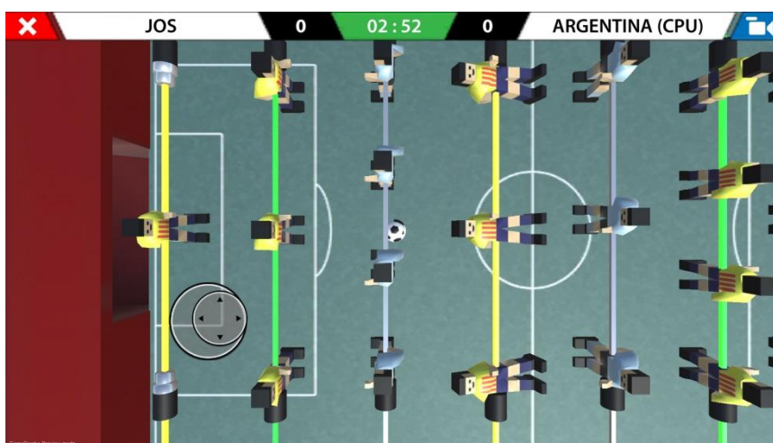
Modo de pocos polígonos, para móviles de gama media-baja.